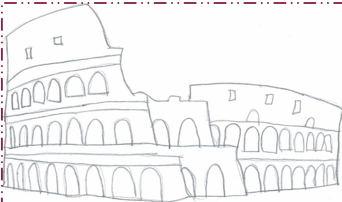
Il Colosseo—Rebecca Simeone